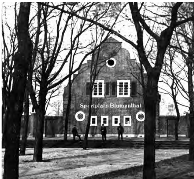
Abb. 1: „Sportplatz Blumenthal“ am Appellplatz, 1926